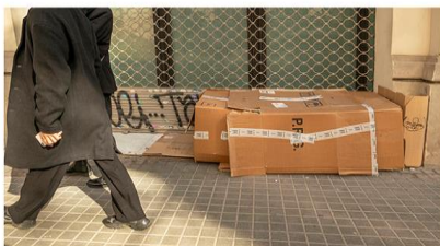
Habitació sense vistes C/ Casp