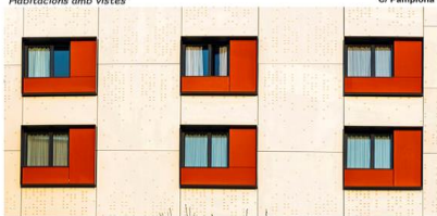
Habitacions amb vistes Toni Garcia Camps